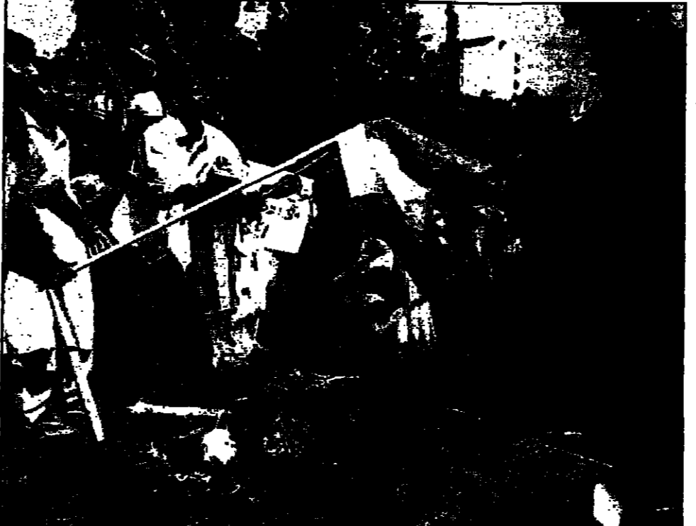
مؤتمر حركة البهاجرين الديمقراطيين الباكستانية يحرقون علم الهند خلال مظاهرة دعمتها الحركة في كراتشي اسم طالبه حكومة خوزف باجرا - تجربة نووية (ديفيس)